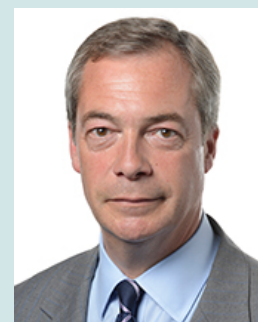
Formand Nigel Farage

Som formand for partigruppen er det dit ansvar at lægge den overordnede politiske strategi. Du skal derfor diskutere med din særlige rådgiver hvilke partier, I ønsker at lave alliancer med. Som formand har du også det sidste ord, når det kommer til miljøpolitikken, men du lytter selvfølgelig til råd fra partigruppens medlem i miljøudvalget.