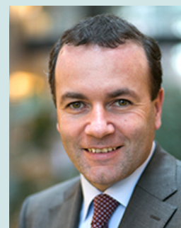
Formand Manfred Weber

Som formand for partigruppen er det dit ansvar at lægge den overordnede politiske strategi. Du skal derfor diskutere med din særlige rådgiver hvilke partier, I ønsker at lave alliancer med. Som formand har du også det sidste ord, når det kommer til miljøpolitikken, men du lytter selvfølgelig til råd fra partigruppens medlem i miljøudvalget.