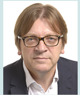
Partiformand Guy Verhofstadt

Som formand for partigruppen er det dit ansvar at lægge den overordnede politiske strategi. Du skal derfor diskutere med din særlige rådgiver hvilke partier, I ønsker at lave alliancer med. Som formand har du også det sidste ord, når det kommer til miljøpolitikken, men du lytter selvfølgelig til råd fra partigruppens medlem i miljøudvalget.